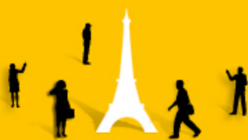
Image de synthèse 3D Studio Max : niveau 2